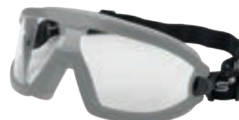
IRAM EN166 ANSI Z87.1 (Z87+)