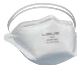
NIOSH TC- 84A-9317 FDA

Respirador descartable plegable para partículas N95.