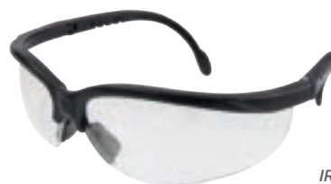
IRAM EN 166 ANSI Z87.1 (Z87+)

Lentes de seguridad medio marco con puente nasal.