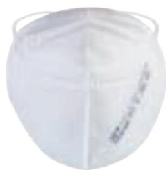
ABNT NBR 13698:2011 FDA

Respirador descartable para partículas Pff2/N95.