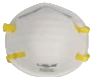
NIOSH N95 FDA

Respirador descartable para partículas N95.