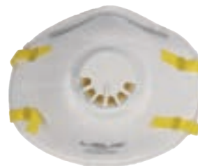
NIOSH N95 FDA

Respirador descartable para partículas N95 con válvula.